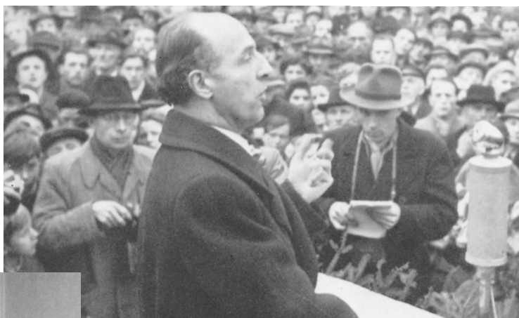
Auf einer Grenzlandkundgebung in Düren gab Karl Arnold am 13. März 1949 bekannt, dass er den britischen Außenminister Bevin zu einem Besuch Nordrhein-Westfalens eingeladen habe. Damals war der deutsch-niederländische Streit um die von Den Haag beanspruchten deutschen Grenzlande voll entbrannt. Ende April 1949 kam es trotz der massiven Abwehrkampagne Arnolds zu den „Grenzkorrekturen“, von denen Nordrhein-Westfalen besonders betroffen war. (Quelle: Landtagsarchiv)