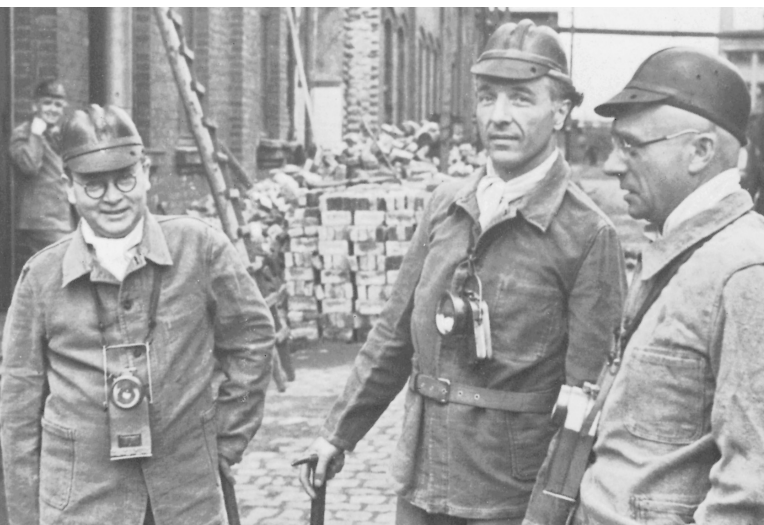
Ministerpräsident Karl Arnold bei einem Zechenbesuch im Ruhrgebiet Anfang Juni 1948. Die Demonstration hatte politische Hintergründe: Um die Kohleförderung zu steigern, batte Arnold am 5. Juni 1948 eine „Kohlekonferenz“ nach Düsseldorf einberufen. Die Apelle dieser Zusammenkunft – deutsche Zuständigkeit für den Kohlebergbau, Demontagestopp und Währungsreform – richteten sich in erster Linie an die Besatzungsbehörden. Links im Bild: der damalige Chef der NRW-Landeskanzlei, Hermann Wandersleb.